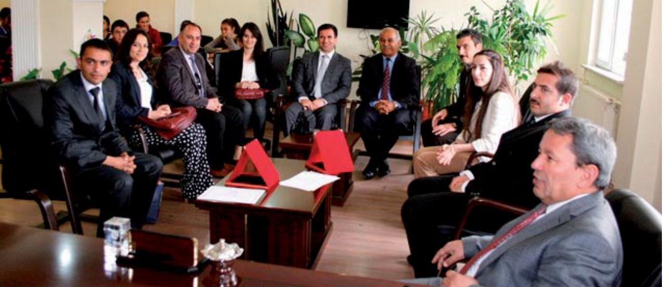
EKYS Ödül Töreni

öğrencilerin katılımıyla Eğitimde Kalite Yönetim Sistemi Ödül Töreni; gerçekleştirilmiştir.