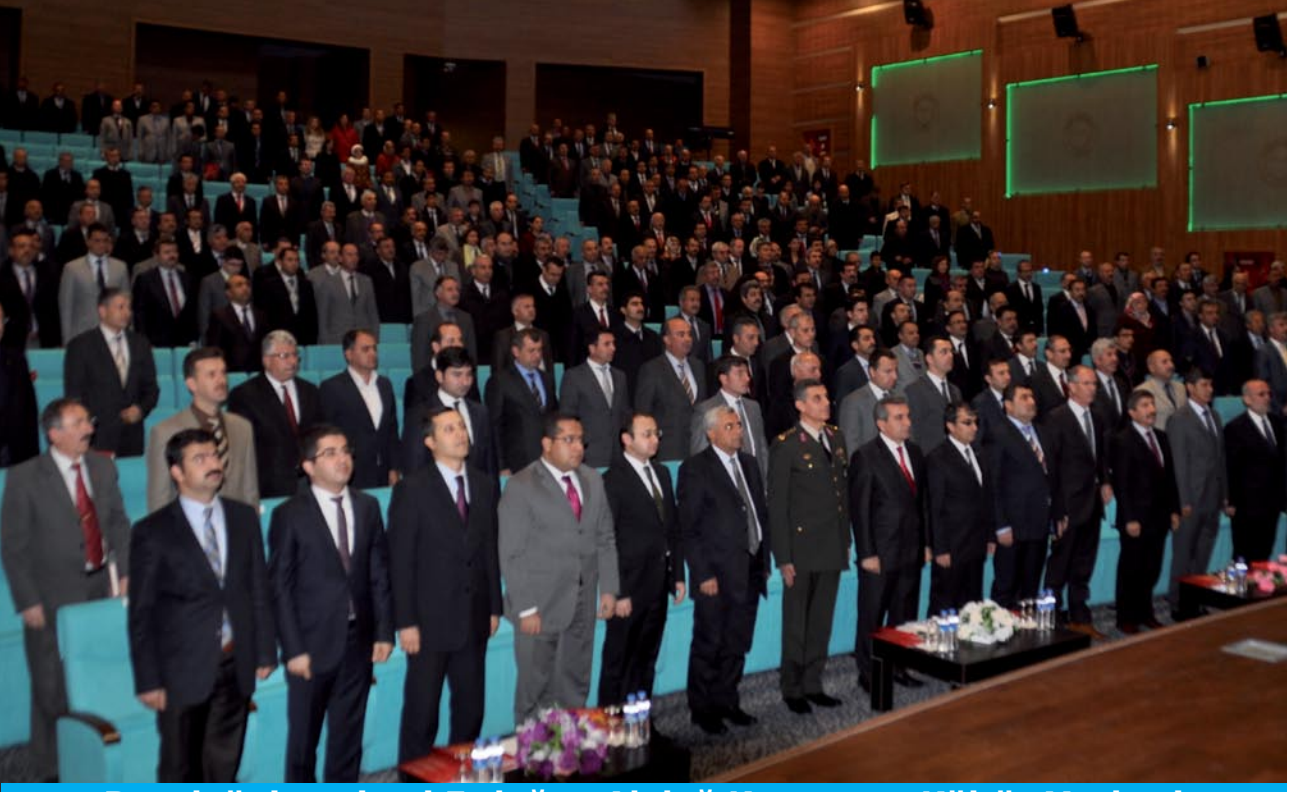
Bozok Üniversitesi Erdoğan Akdağ Kongre ve Kültür Merkezi EKAP Açılış Toplantısı

Y ozgat Valiliği, Yozgat Belediye Başkanlığı, Bozok Üniversitesi ve İl Milli Eğitim Müdürlüğümüz arasında imzalanan "Eğitimde İşbirliği Protokolü" kapsamında hazırlanan "Yozgat Eğitiminde Kaliteyi Artırma Projesi'nin" amacı eğitim öğretimde ilimizin mevcut durumunu tespit etmek, bu tespitlerden hareketle yapılacak olan değerlendirmeler ışığında, kaynakları ve eğitimde etkisi bulunan tüm unsurları mümkün olan en etkin ve verimli şekilde kullanarak, eğitim faaliyetlerinin kalitesini Türk Milli