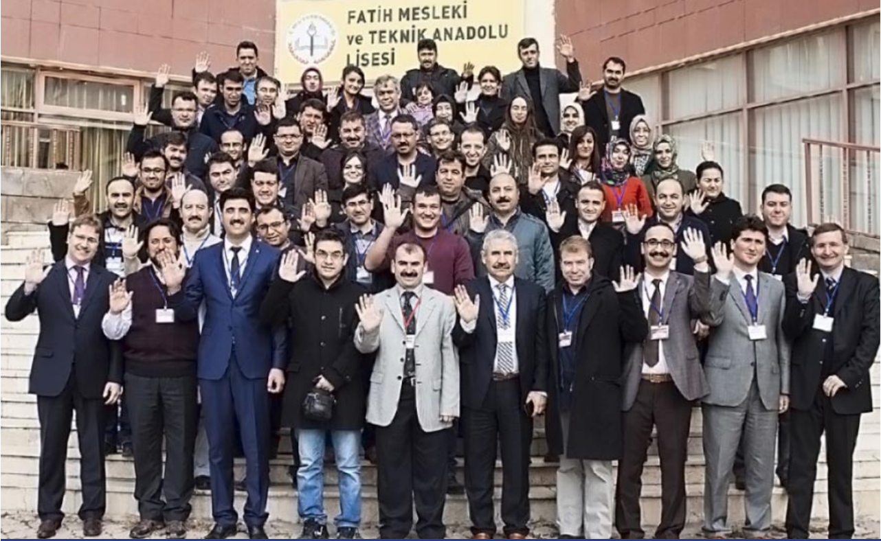
29 Kasım 2014 Proje Danışmanlığı Eğitimi

Yozgat Valiliği, Yozgat Belediye Başkanlığı, Bozok Üniversitesi ve İl Milli Eğitim Müdürlüğümüz arasında imzalanan "Eğitimde İşbirliği Protokolü" kapsamında hazırlanan "Yozgat Eğitiminde Kaliteyi Artırma Projesi" ile eğitim öğretimde ilimizin mevcut durumunu tespit edilmiş ve Proje faaliyetleri beş ana başlık altında toplanarak uygulanabilirliği ve izlenebilirliği sağlanmıştır. Projenin birinci yılına ait faaliyet alanları değerlendirilmiş ikinci yıl faaliyet alanlarına ilişkin hedefler okullarımızdan talep edilmiştir.