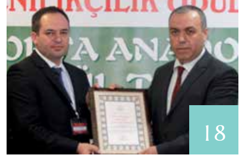
EĞİTİM VE ÖĞRETİMDE YENİLİKÇİLİK ÖDÜLLERİ ORTA ANADOLU ÖDÜL TÖRENİ