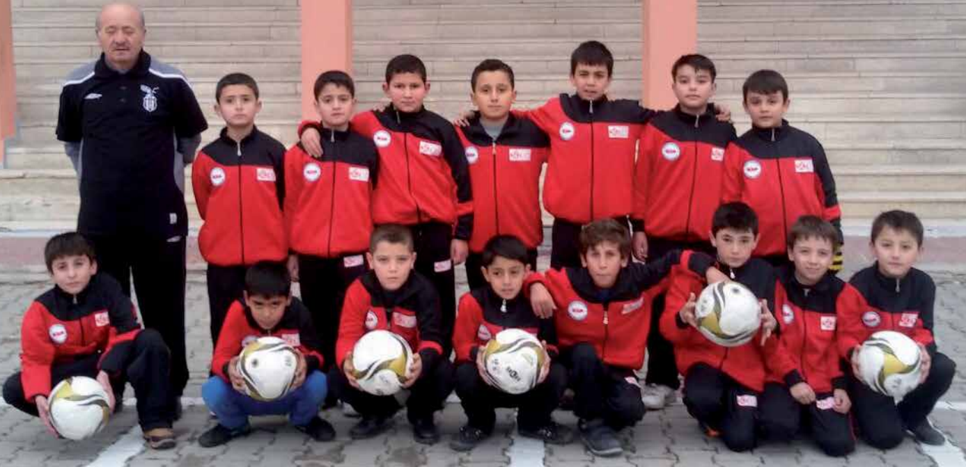
TOKİ İlkokulu - Yerköy / Yozgat

basketbol ve futbol kursları açılmıştır. Kurslara katılan öğrencilere spor malzemeleri alınmıştır. Kurslarımızın sonunda okullar arası turnuvalar düzenlenecek olup bu turnuvalarda dereceye girenler ödüllendirilecektir.