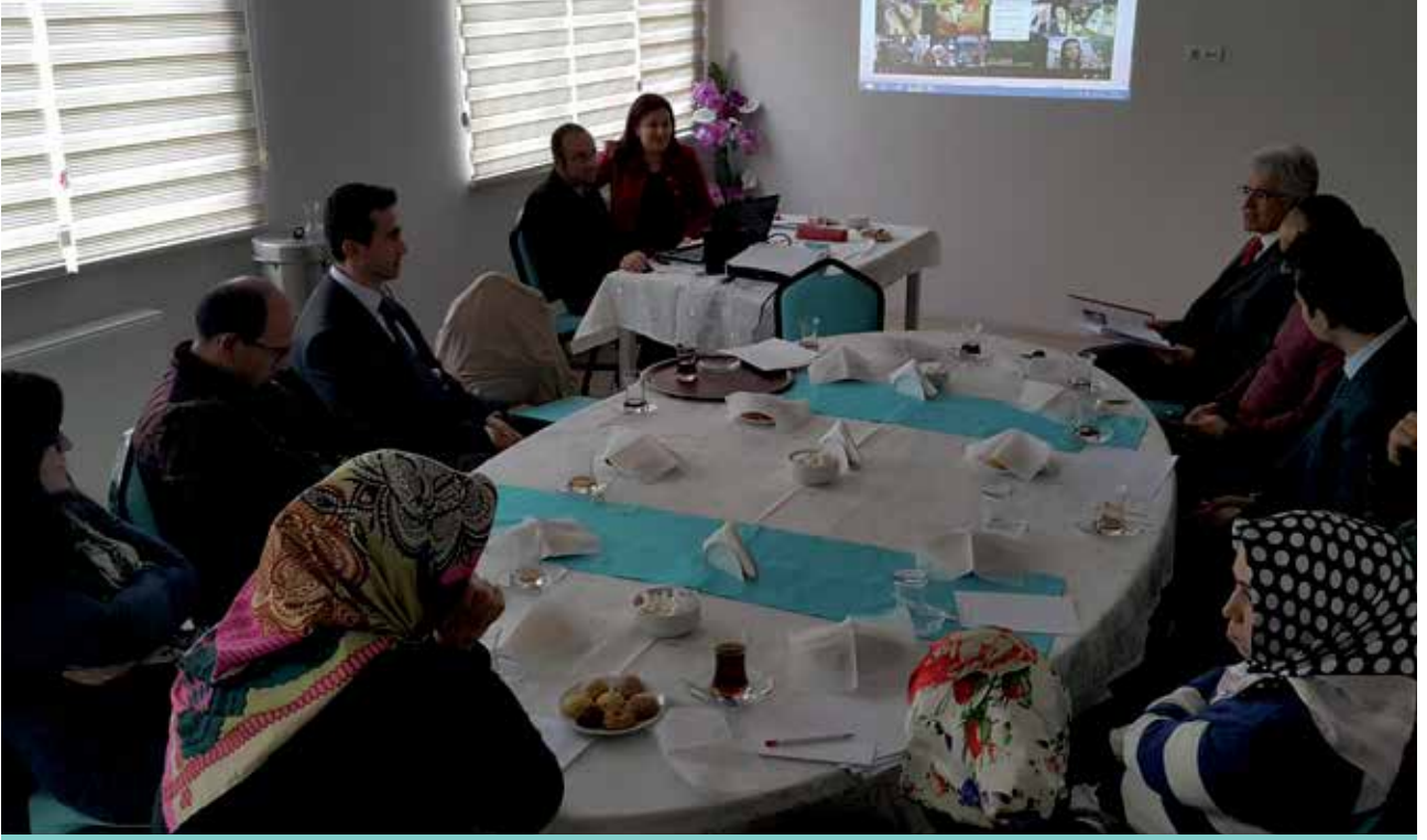
BOZOK Üniversitesi Konukevi ve Sosyal Tesisleri - 12 Kasım 2015

B ozok Üniversitesi Eğitim Fakültesi öğretim üyelerinin yürütmekte olduğu bilimsel araştırma projesi kapsamında İl Milli Eğitim Müdürlüğü ARGE Birimi koordinasyonunda Müdürlüğümüze bağlı okullarda görev yapmakta olan Matematik Öğretmenlerine yönelik bir eğitim programı uygulandı.