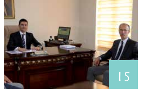
2015 - 2019 YOZGAT İL MEM STRATEJİK PLANI ONAYLANDI