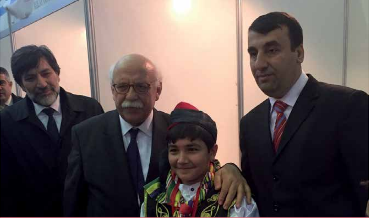
Millî Eğitim Bakanımız Sayın Nabi AVCI ile 2. Türk Dünyası Bilim Olimpiyatları / Eskişehir

Y ozgat'ta üstün yetenekli öğrencilere proje tabanlı eğitim veren Fatma Temel Turhan Bilim Sanat Merkezi öğrencilerinin hazırladığı maden kazalarında ölüm ve yaralanma risklerini sıfıra indirmeyi amaçlayan "Akıllı Maden" projesi 2. Türk Dünyası Bilim Olimpiyatlarında 1257 proje başvurusundan ilk 60 proje arasına girerek Eskişehir 2. Türk Dünyası Bilim Olimpiyatlarına davet edilip Milli Eğitim Bakanımız Prof. Dr. Sayın Nabi AVCI tarafından Jüri özel ödülüne layık görüldü. Türk Dünyasından 40 projenin yarıştığı olimpiyat 24-25 Aralık'ta yapılmış olup Milli Eğitim Bakanı Nabi AVCI'nın katılımıyla gerçekleşmiştir.