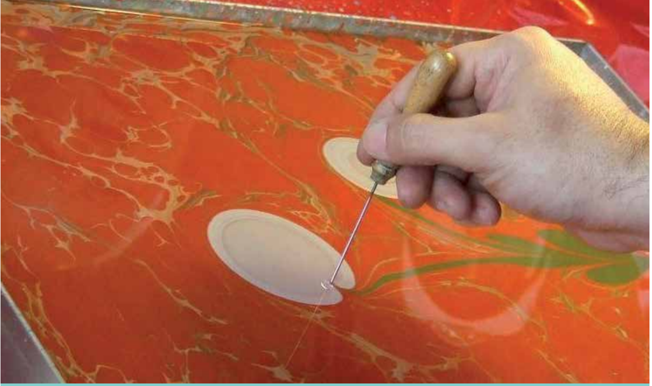
SODES Kapsamında D¼zenlenen Ebru Kursu - Kadıřehri İlçe MEM / Yozgat

S ODES kapsamında hazırladıđımız K¼¼¼k Adımlar B¼y¼k Dokunuřlar isimli projemizin önceliđi olan "ilçemizdeki dezavantajlı öğrencilere nitelik kazandırmak ,sosyalleşmelerini sağlamak ve hayata uyumlarını kolaylařtırmak ve projenin önceliđi olan Bařta dezavantajlı bireyler olmak üzere bütün bireylerin eğitim beceri kazanma ve nitelik artırma, sosyaluyum, sosyal hizmet ve sosyal nitelikli kurumsal kapasite geliştirme gibi faaliyetlere erişimlerinin ve katılım düzeylerinin artırılması" amacına hizmet etmektedir.