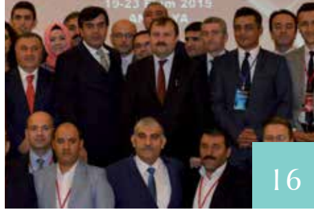
STRATEJİK PLAN İZLEME VE DEĞERLENDİRME SEMİNERİ