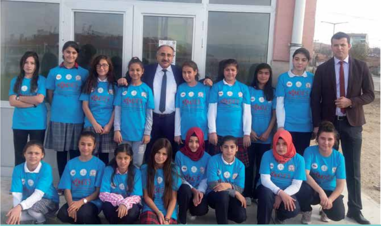
Fatih Sultan Mehmet Ortaokulu - Yerköy / Yozgat

Yerköy İlçe Milli Eğitim Müdürlüğü olarak ilçemizde tüm taşıma merkezi olan Yerköy TOKİ İlkokulu , Sekili Şehit Osman Pekşen İlköğretim Okulu, Fatih Sultan Mehmet Ortaokulu, Saray Yibitaş Lafarge İlköğretim Okulu okullarımızdaki öğrencilerimize yönelik 0-18 (İlkokul - ortaokul çağındaki çocuklar) yaş arası çocuklar için Türkiye Cumhuriyeti Kalkınma Bakanlığı Sosyal Destek Programı Kapsamında SODES Projesi olarak "Taşımali Eğitim Okullarında Hayat Sporla Güzeldir" projesi hazırlanarak uygulamaya geçilmiştir.