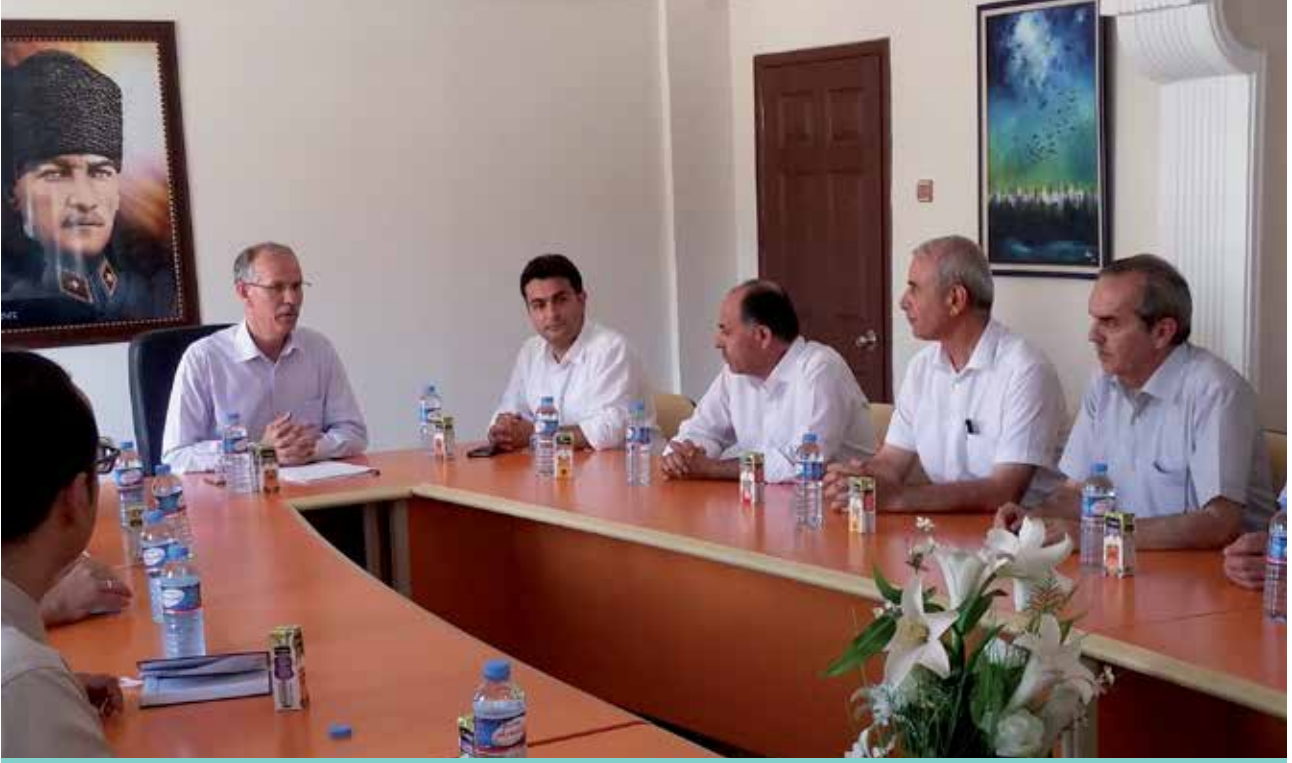
Stratejik Plan Üst Kurul Toplantısı - 6 Ağustos 2015

İl Millî Eğitim Müdürlüğü 2015-2019 stratejik planlama çalışmaları 2013/26 sayılı Genelge ve Stratejik Plan Hazırlık Programı ile başlatılmış ve bu kapsamda yürütülen çalışmalar sonucunda İl Millî Eğitim Müdürlüğü 2015-2019 Stratejik Planı tamamlanmıştır.