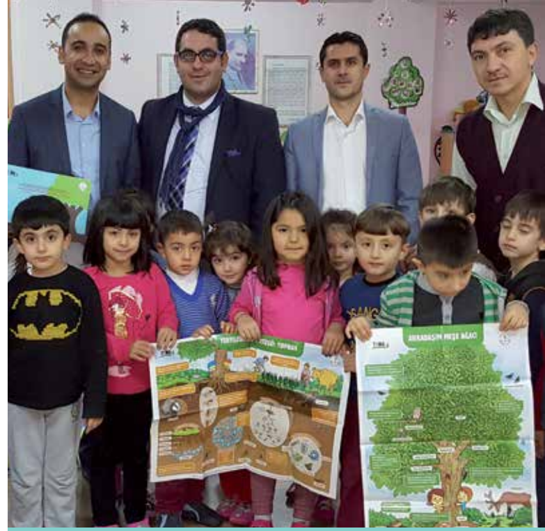
75. Yıl Anaokulu - Minik Tema Materyal Dağıtım

Ortaokul TEMA; Minik ve Yavru TEMA Programını uygulayan sınıflar için Meşe ve Toprak posterleri, Gözlem Kutusu, öğretmenler için ise