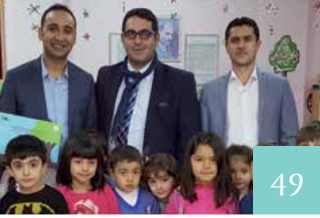
TEMA VAKFI & İL MİLLİ EĞİTİM MÜDÜRLÜĞÜ