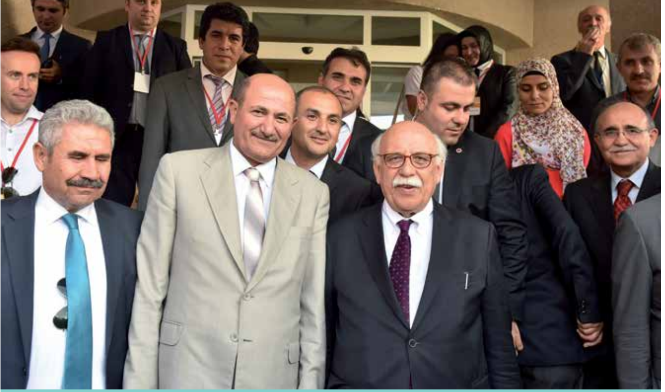
Sayın Millî Eğitim Bakanımız Nabi AVCI ile Mesleki Teknik Eğitim Fuarı Açılışı - ANKARA

O kulumuz 1945-1946 yılında Sanat Enstitüsü olarak öğretime başlamıştır. 2015-2016 Öğretim yılı itibarıyla; Elektrik-Elektronik Teknolojisi Alanı, Bilişim Teknolojileri Alanı, Makine Teknolojisi Alanı, Mobilya ve İç Mekân Tasarımı Teknolojisi Alanı, Metal Teknolojisi Alanı olmak üzere 5 alanda eğitim öğretim faaliyetine devam etmektedir.