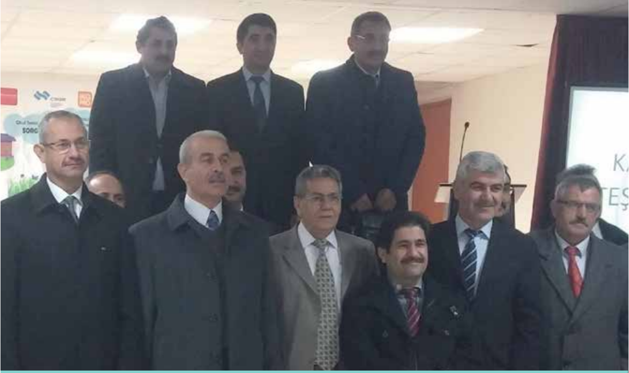
Proje Tanıtım Toplantısı - Sorgun Ağahefendi Ortaokulu - 14 Aralık 2015