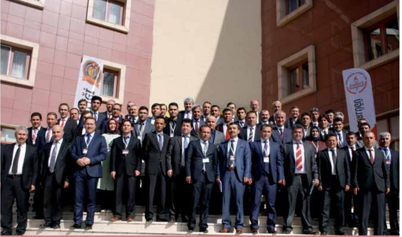
Eğitim ve Öğretimde Yenilikçilik Ödülleri Orta Anadolu Ödül Töreni 27 Ekim 2015 Yozgat