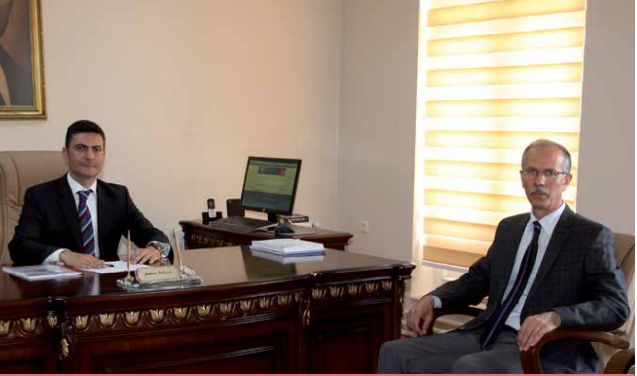
Sayın Vali Yardımcımız Gökhan İKİTEMUR ve Sayın İl MEM Müdürümüz Saim KUŞ

İl Millî Eğitim Müdürlüğü 2015-2019 stratejik planlama çalışmaları 2013/26 sayılı Genelge ve Stratejik Plan Hazırlık Programı ile başlatılmış ve bu kapsamda yürütülen çalışmalar sonucunda İl Millî Eğitim Müdürlüğü 2015-2019 Stratejik Planı tamamlanmıştır.