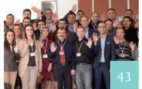
PROJEDE KALİTE EĞİTİMİ