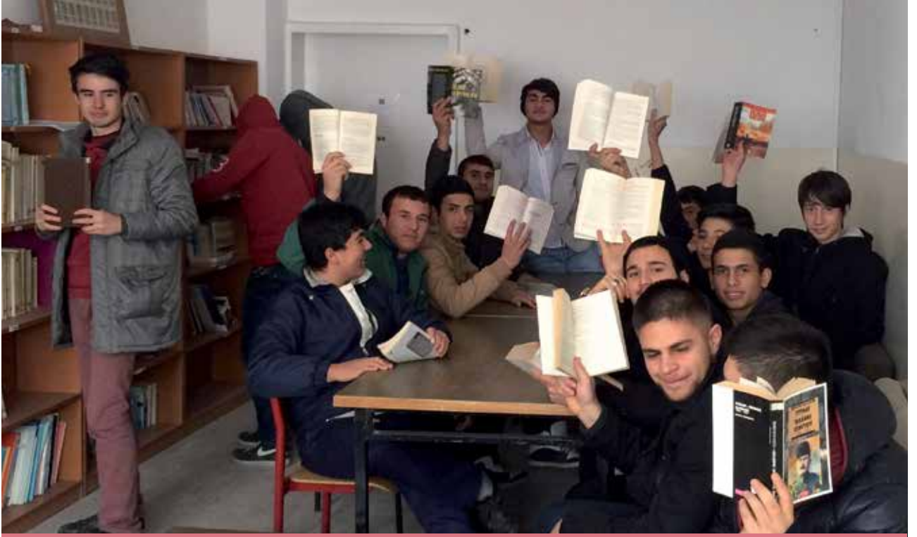
“Telefonları Bırak, Kitaplara Bak”