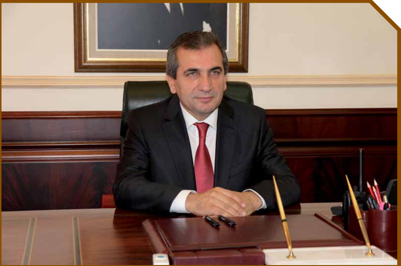
Abdulkadir YAZICI - Yozgat Valisi

En büyük değerimiz ve zenginlik kaynağımız, sahip olduğumuz genç ve dinamik nüfusumuzdur. Çocuklarımız ve gençlerimizin; milli manevi değerlerle yoğrulmuş, özgüvenli, rekabetçi, teknolojiye geleceğe yön vermede kullanan, yenilikçi, nitelikli ve bilgi ile donatılmış bireyler olması vazgeçilmez hedefimiz olmuştur. Eğitim alanında gerek fiziki ve teknolojik alt yapı, gerek eğitime erişim gerekse de kalite konusunda çok önemli gelişmeler kaydettik.