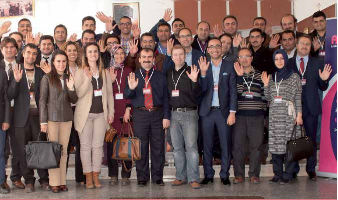
Projede Kalite Eğitimi - 28 Kasım 2015 Yozgat