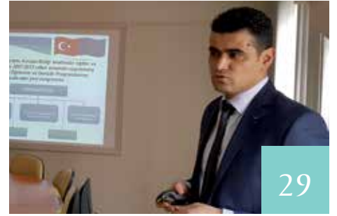
ÖĞRETMENLERİN BİLİŞİM TEKNOLOJİLERİ KULLANIM YETERLİLİKLERİNİN ARTIRILMASI