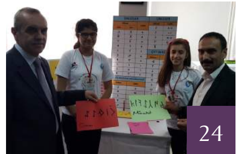
TÜBİTAK 4006 BİLİM FUARLARI BİLGİLENDİRME TOPLANTISI